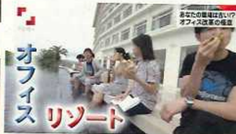
NHKクローズアップ現代 (H30.6.26)