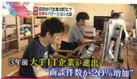
読売テレビ かんさい情報ネットten (H30.10.9)